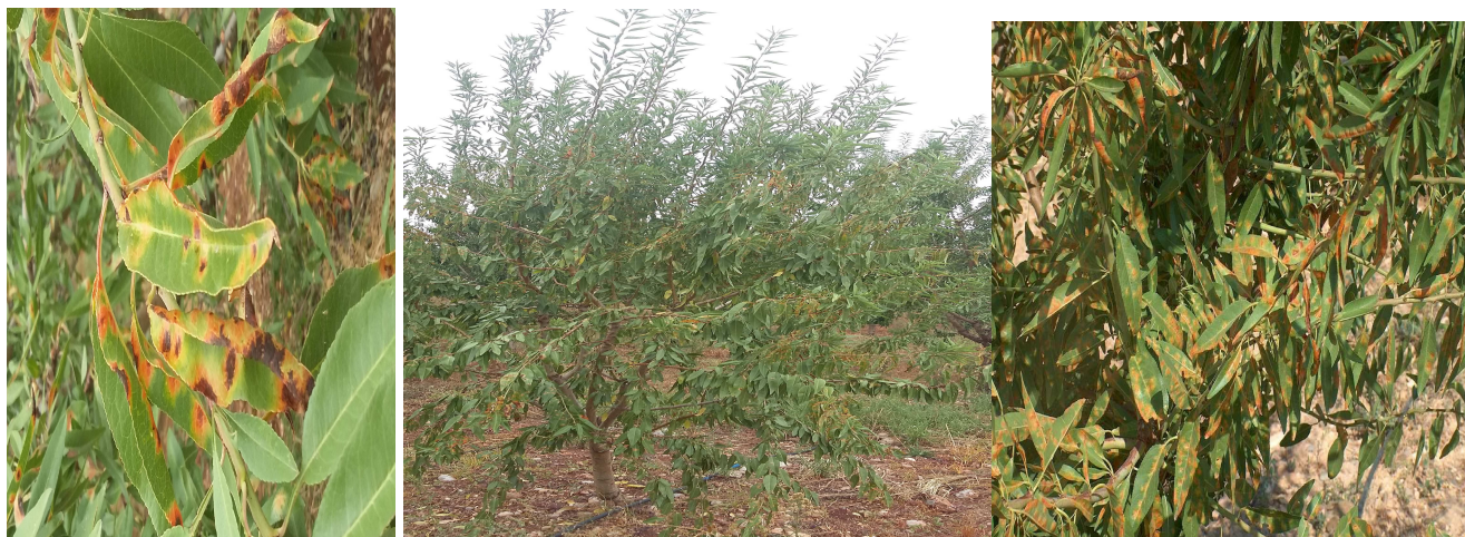
Εικ.4 5.6 ΠΚΠ.Φ Βόλου Προσβολή από ΠΟΛΥΣΤΙΓΜΩΣΗ ( Polystigma ochraceum )

Μετά τις έντονες βροχοπτώσεις των τελευταίων ημερών αναμένεται η είσοδος της πολυστίγμωσης σε Αμυγδαλώνες των Νομών Μαγνησίας, Λάρισας και Φθιώτιδας.