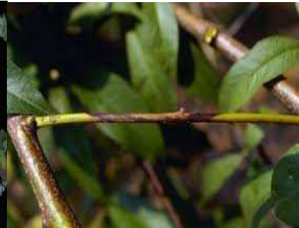
Εικ.3. Π.Κ,Π,Φ Βόλου Προσβολή από Fusicoccum amygdali

Μετά τις έντονες βροχοπτώσεις των τελευταίων ημερών αναμένεται η είσοδος της Φώμοψης phomopsis amygdali (συν. Fusicoccum amygdali ) σε Αμυγδαλεώνες με ιστορικό στην ασθένεια των Νομών Μαγνησίας Λάρισας και Φθιώτιδας.