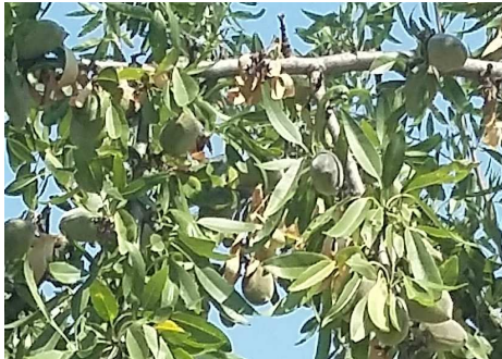
Εικ.1 Π.Κ,Π,Φ Βόλο

Phomopsis amygdali (συν. Fusicoccum amygdali )