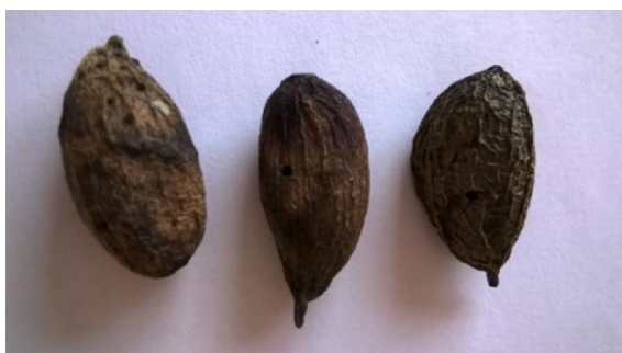
Εικ. 2. Μουμιοποιημένοι καρποί φιστικιάς.

Ένα ποσοστό των καρπών αυτών καλό είναι να ελέγχεται για την παρουσία προνυμφών στο εσωτερικό τους, ώστε να τοποθετηθούν σε πλαστικά ή γυάλινα διαφανή δοχεία την ερχόμενη άνοιξη, για τον ακριβή προσδιορισμό της εξόδου του εντόμου και την αποφυγή άσκοπων ψεκασμών πριν την εμφάνισή του.