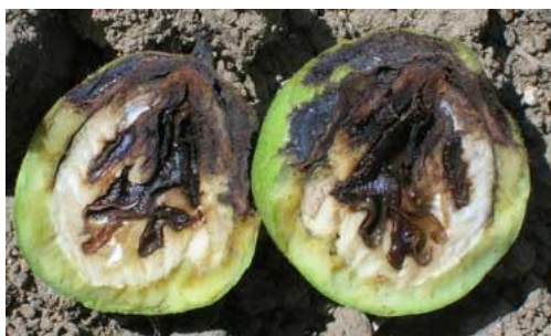
Εικ. 6. Μαύρισμα ψίχας