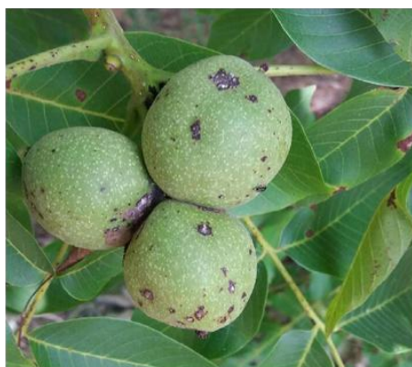
Εικ. 11. Προσβολή καρπού