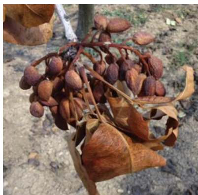
Εικ. 1. Ταξικαρπία προσβεβλημένη από βοτρυοσφαίρια.

Συστήνεται συλλογή και καταστροφή των προσβεβλημένων από βοτρυοσφαίρια ταξικαρπιών της περσινής περιόδου (εικ. 1), καθώς και των αντίστοιχων κλάδων που τις φέρουν. Τα προσβεβλημένα όργανα που απομένουν πάνω στα δένδρα αποτελούν την κύρια πηγή μόλυσματος για τις πρωτογενείς μολύνσεις την ερχόμενη άνοιξη.