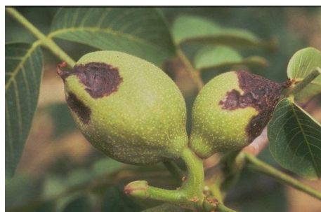
Εικ. 4 & 5. Προσβολή καρπών