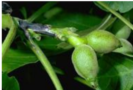
Εικ. 7. Προσβολή τρυφερού βλαστού