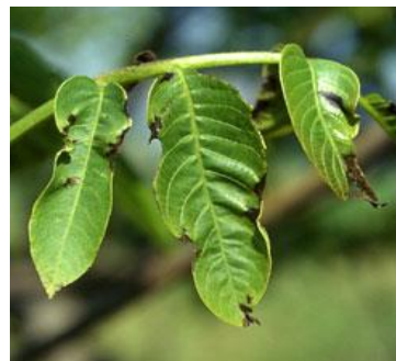
Εικ. 8 & 9. Προσβολή φύλλων