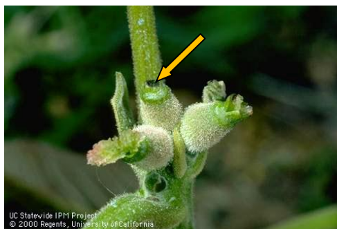
Εικ. 3. Προσβολή θηλυκού άνθους