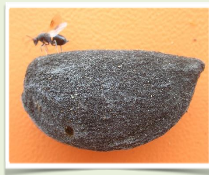
Εικ 2. Ευρύτομο (Π.Κ.Π.Φ.Π. & Φ.Ε.-ΚΑΒΑΛΑΣ)

Επισημαίνεται ότι η έξοδος του εντόμου και η δραστηριότητά του διαρκεί, 20 - 25 ημέρες. Το ευρύτομο θεωρείται από τους σπουδαιότερους εχθρούς της αμυγδαλιάς και η μη έγκαιρη αντιμετώπισή του μπορεί να επιφέρει σημαντική οικονομική ζημιά στην παραγωγή.