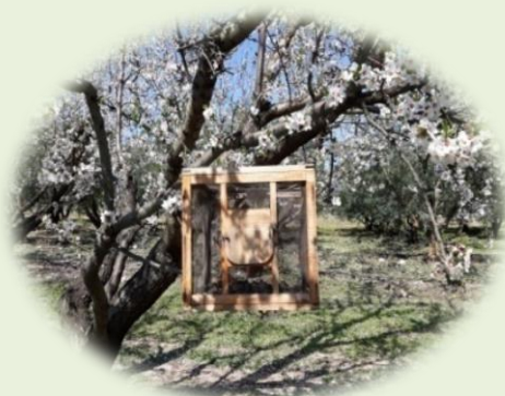
Εικ. 1. Κλωθός παρακολούθησης του Ευρύτομου στην παραλία Οφρυνίου Καβάλας (Π.Κ.Π.Φ.Π. & Φ.Ε.-ΚΑΒΑΛΑΣ)

Από επιτόπιους ελέγχους και παρατηρήσεις που έγιναν στο δίκτυο των κλωθών με προσβεβλημένα αμύγδαλα που έχει εγκαταστήσει η υπηρεσία μας, διαπιστώθηκε ότι ξεκίνησε η έναρξη της πτήσης του εντόμου στην ΠΕ Καβάλας.