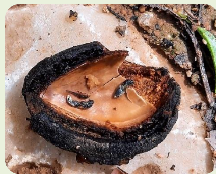
Εικ 3. Τέλεια έντομα ευρύτομου σε κέλυφος αμυγδάλου (Π.Κ.Π.Φ.Π.& Φ.Ε.-ΚΑΒΑΛΑΣ)

Τονίζεται ότι οι ψεκασμοί θα πρέπει να γίνονται κατά τις θερμές ώρες της ημέρας με ηλιοφάνεια, οπότε και παρατηρούνται μεγαλύτεροι πληθυσμοί του εντόμου σε δραστηριότητα. Συνιστάται να μην ψεκάσουμε τις ημέρες με συννεφιά γιατί τότε δεν καταγράφεται σημαντική δραστηριότητα του εντόμου.