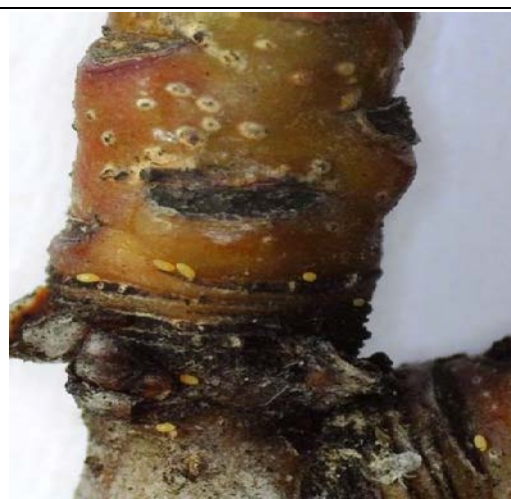
Ακμαία και ωά Cacopsylla pyri