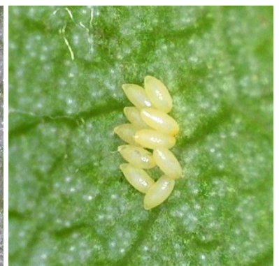
Αυγά νέα-λευκά, αυγά ώριμα-κίτρινα και προνύμφη που εκκολάπτεται όπως φαίνονται από μεγέθυνση

Ο Προϊστάμενος του Π.Κ.Π.Φ.Π. & Φ.Ε. Θεσσαλονίκης