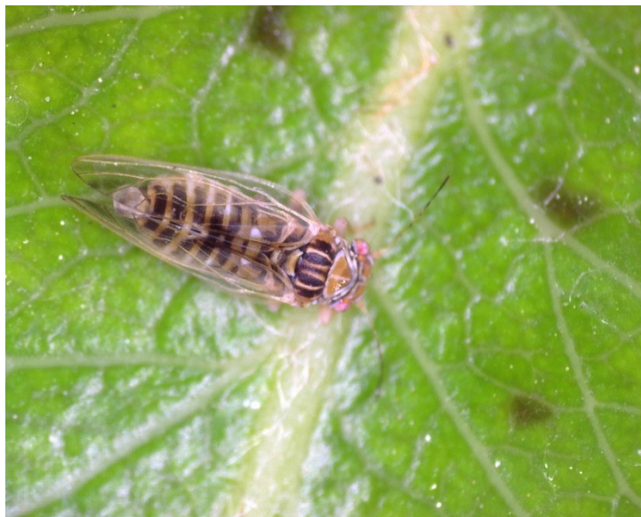
Τέλειο έντομο Cacopsylla pyri της ανοιξιάτικης πτήσης