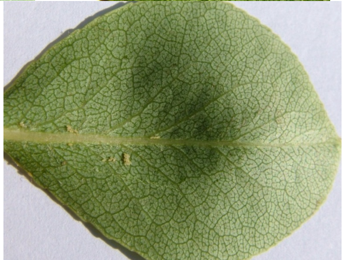
Αυγά και προνύμφες Cacopsylla pyri όπως φαίνονται με γυμνό μάτι