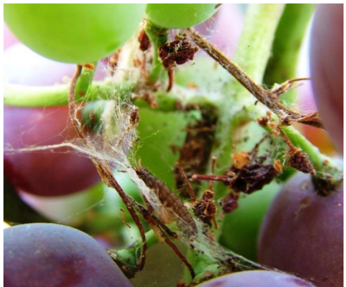
Εικόνα 2. Αυγά και προνυμφική δραστηριότητα Ευδεμίδας