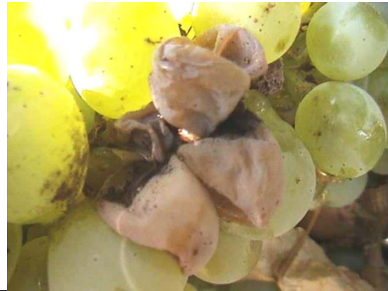
Εικόνα 1. Άμεση βλάβη των ραγών από Ευδεμίδα και έμμεση βλάβη από Βοτρύτη