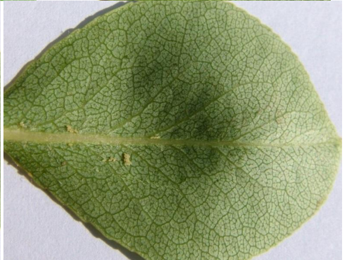
Αυγά και προνύμφες Cacopsylla pyri όπως φαίνονται με γυμνό μάτι