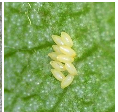
Αυγά νέα-λευκά, αυγά ώριμα-κίτρινα και προνύμφη που εκκολάπτεται όπως φαίνονται από μεγέθυνση

Η Αν. Προϊσταμένη του Π.Κ.Π.Φ.Π. & Φ.Ε. Θεσσαλονίκης