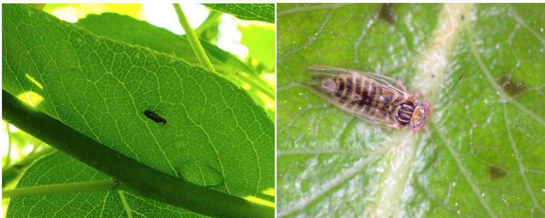
Τέλειο έντομο Cacopsylla pyri της ανοιξιάτικης πτήσης