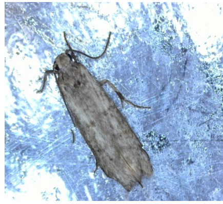
Πυρηνοτρήτης ( Prays oleae )