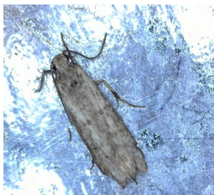
Πυρηνοτρήτης ( Prays oleae )