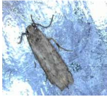
Πυρηνοτρήτης ( Prays oleae )