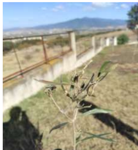
Μαργαρόνια σε νεαρά δενδρύλλια